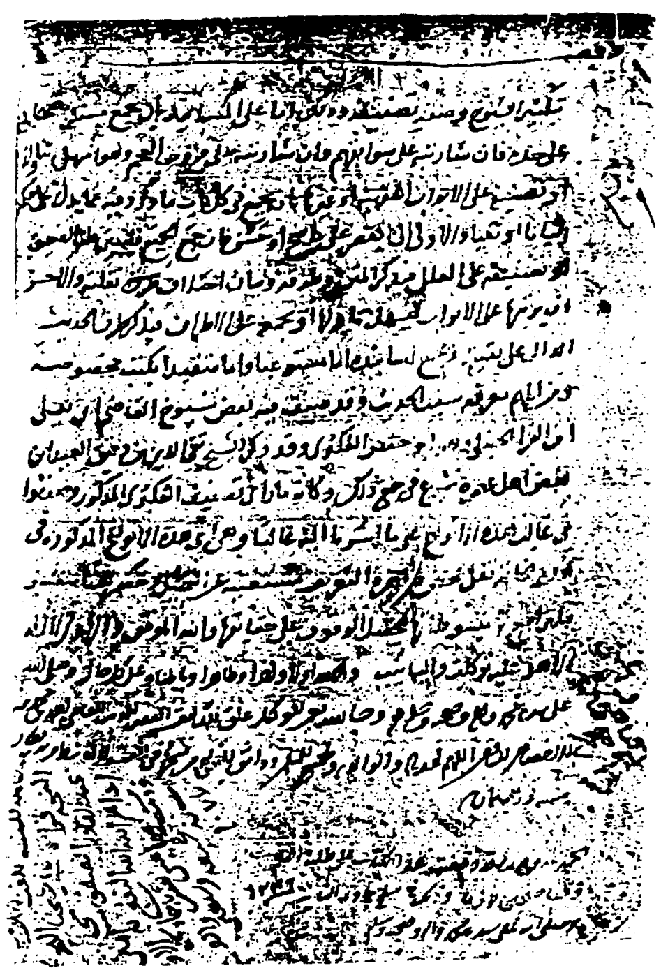
الصفحة الأخيرة ، عليها خط ابن الأخصاصي بتعليقه الكتاب أي نسخه لنفسه وفي الحاشية اليمنى بخط الحافظ ابن حجر: (بلغ ضاحبه قراءة علي . كتبه ابن حجر،